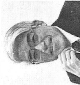
坂和利 田国電影大賞（2004年）「哭き女のオウちゃん」主演。映画を断る「シリ」で知られる映画に詳しい書き手。2004年大阪府日友好協会賞

り同性愛を描いたため、その傾向はこの『哭き女』でも顕著だ。慣れ切った結果、その後は指名が次々とくるものになり…。監督である劉琴氏の作品は、デビュー作『風』（1996年）も『男男女女』（84）も中国では上映許可が下りなかった。これらの映画が中国の民族色や開拓精神を濃厚に打ち出した