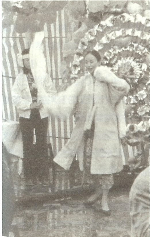
『涙女』 アーティストフィルムよりDVD発売中

はじめは半信半疑でヨーミンの言葉に従ったグイも、最初の仕事で先輩の哭き女からバカにされるや、一念発起。カセットテープを聴きながら猛練習に励んだ結果、今ではご指名の注文(?)が次々と……。奥さんの目を盗んでヨーミンとベッドの上で「励んでいる(?)」最中でも、テレビで大きな事故が報道されるや、コトを中止して、たちまち現場